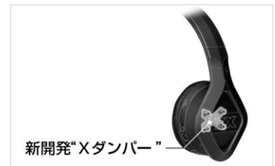
<“Xダンパー”イメージ>