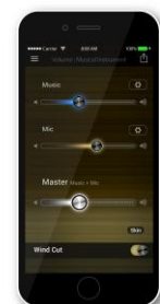
＜アプリケーションイメージ＞