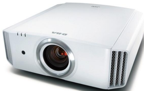
<DLA-X590R (ホワイト) >